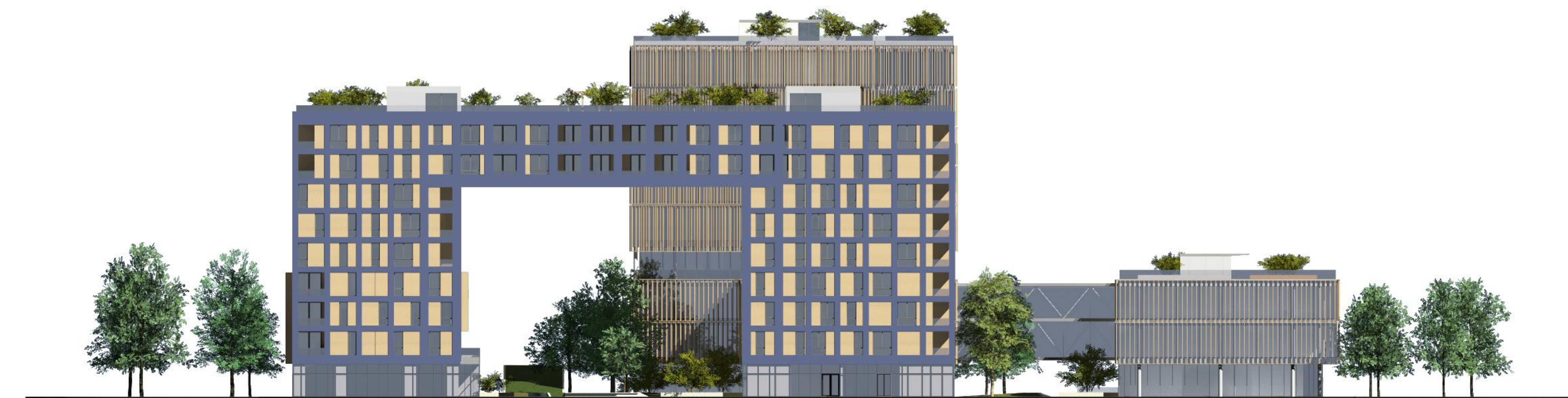
SJEVERNO PROJEKCIJE M 1:200