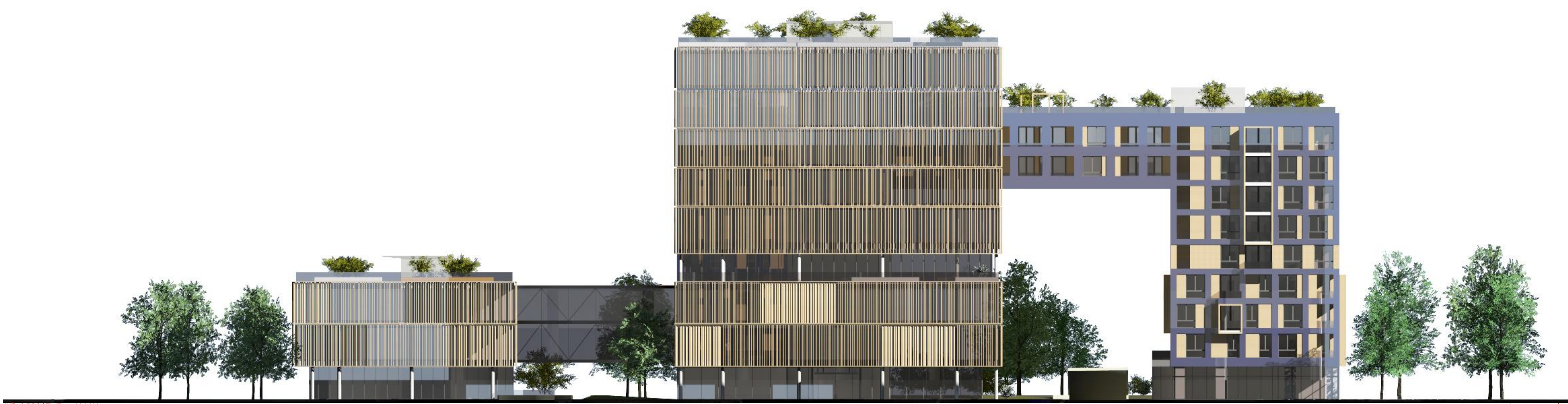
JUŽNO PROJEKCIJE M 1:200