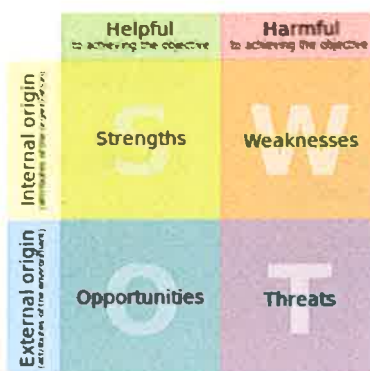
Slika 1: Shema SWOT analize